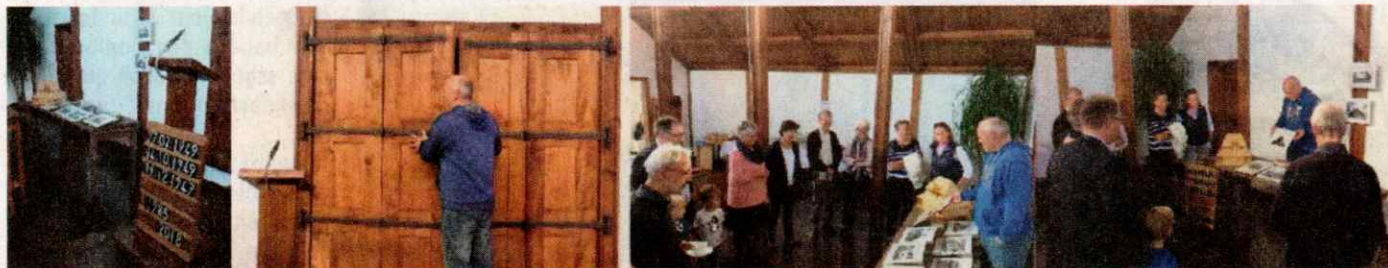
Dialogführungen durch Kirche und Anbau

Erleben, was uns verbindet - Tag des offenen Denkmals 2018 in der Evangelischen Kirche Oberpleis